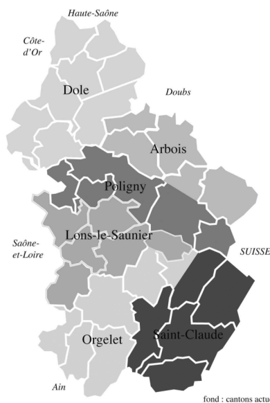
carte 1. — Département du Jura : les districts en 1790

La carte administrative de 1790 permet de les situer.